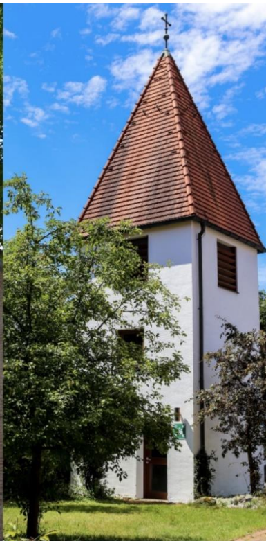
Jesajakirche Balanstraße 361 im Fasangarten