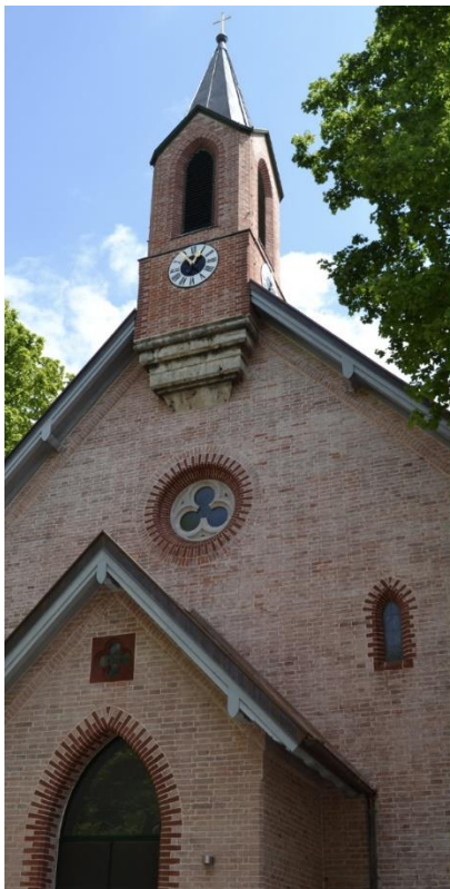
St. Paulus Sebastian-Bauer-Straße 23 in Perlach

Am 29.3. um 19 Uhr in St. Paulus, am 05.4. um 19 Uhr in Jesaja, am 12.4. um 19 Uhr in St. Paulus, am 19.4. um 19 Uhr in Jesaja, usw.