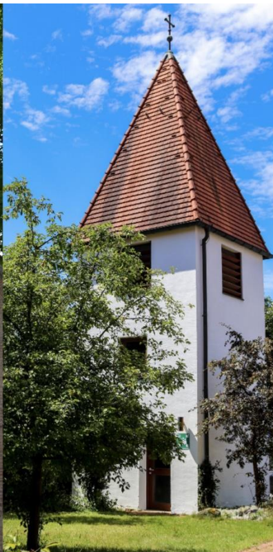
Jesajakirche Balanstraße 361 im Fasangarten