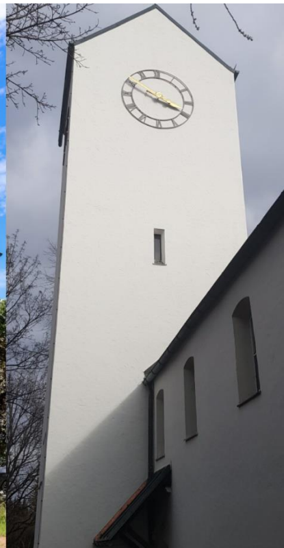
Gustav-Adolf-Kirche Hohenaschauer Straße 3 in Ramersdorf